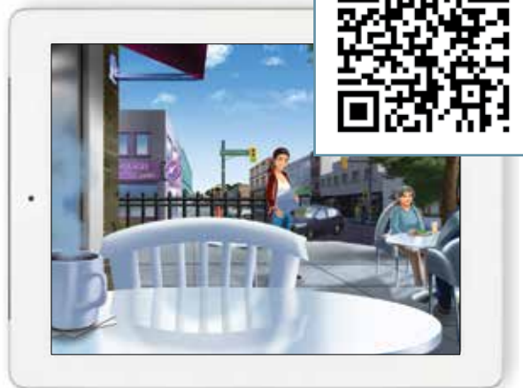
PARCOURS judicieux 2.0