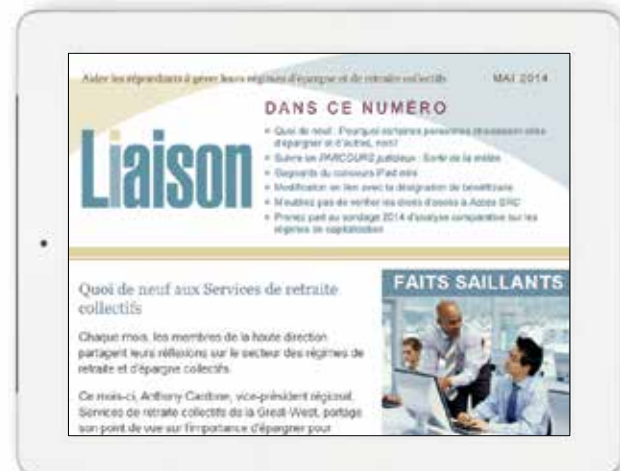
Bulletin électronique Liaison