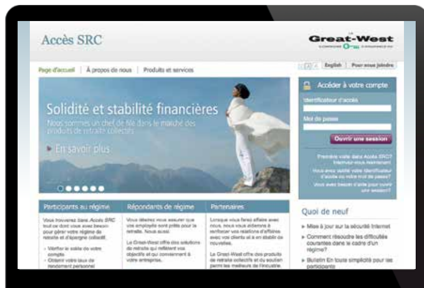
Accès SRC (www.grsaccess.com)