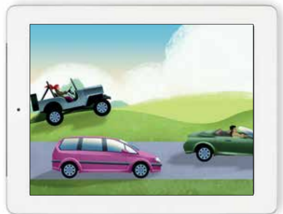
Notre chaîne YouTube